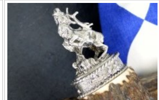
HUBERTUS-Solingen - 26.153.HA.10 H - Hirsch - Detail