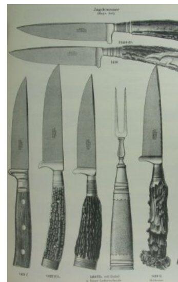
Trachtenmesser - „Jagdmesser bayr. Art“ Musterzeichnungen der Stahlwaren-Fabrik Gebr. Ct Solingen, ca. 1910

Weitere als Trachtenstilett zu verwendende Messer finden Sie in unserer Kategorie: