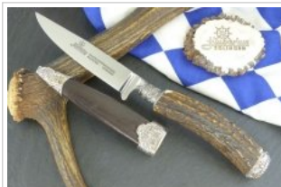
HUBERTUS-Solingen - 26.153.HA.10 - Standardausführung

Auf Anfrage senden wir Ihnen gerne unseren HUBERTUS Faltprospekt zu, der einen Ausschnitt aus unserem Fertigungsprogramm aufzeigt.