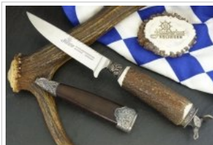
HUBERTUS-Solingen - 26.153.HA.10 A - Auerhahn