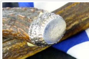
HUBERTUS-Solingen - 26.153.HA.10 - Standardausführung - Detail