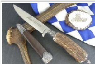
HUBERTUS-Solingen - 26.153.HA.10 S - Schnupftabakdose