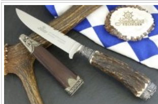
HUBERTUS-Solingen - 26.153.HA.10 LF - Bayerischer Löwe flach