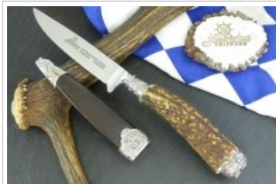
HUBERTUS-Solingen - 26.153.HA.10 - Hubertus