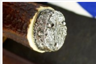
HUBERTUS-Solingen - 26.153.HA.10 EL - Eichenlaub - Detail