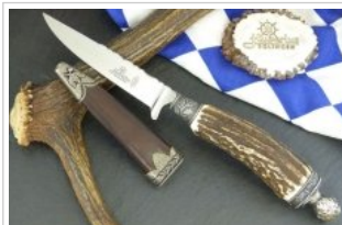
HUBERTUS-Solingen - 26.153.HA.10 KL - König Ludwig