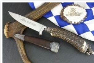
HUBERTUS-Solingen - 26.153.HA.10 L - Bayerischer Löwe