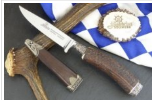
HUBERTUS-Solingen - 26.153.HA.10 EL - Eichenlaub