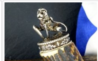
HUBERTUS-Solingen - 26.153.HA.10 L - Bayerischer Löwe - Detail