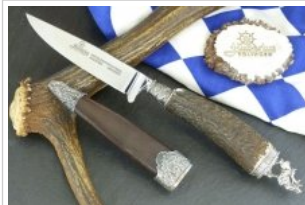
HUBERTUS-Solingen - 26.153.HA.10 H - Hirsch