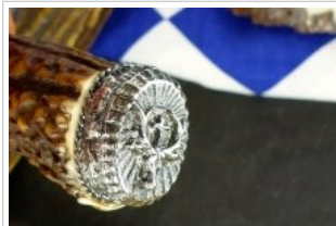
HUBERTUS-Solingen - 26.153.HA.10 - Hubertus - Detail