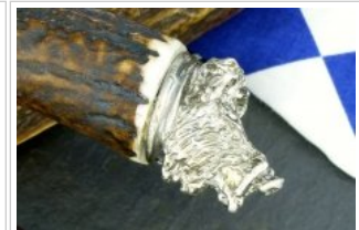
HUBERTUS-Solingen - 26.153.HA.10 K - Keiler - Detail