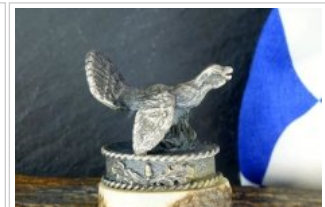
HUBERTUS-Solingen - 26.153.HA.10 A - Auerhahn - Detail