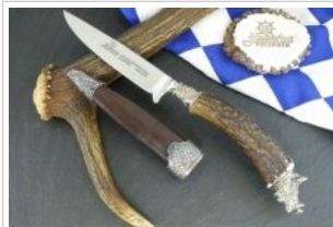
HUBERTUS-Solingen - 26.153.HA.10 K - Keiler