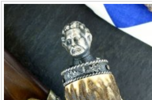
HUBERTUS-Solingen - 26.153.HA.10 KL - König Ludwig - Detail